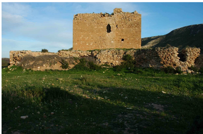
Torre Fuerte o de los Alumbres de Rodalquilar, desde el Oeste