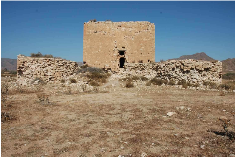
Fachada principal o del Este de la torre Fuerte o de los Alumbres de Rodalquilar