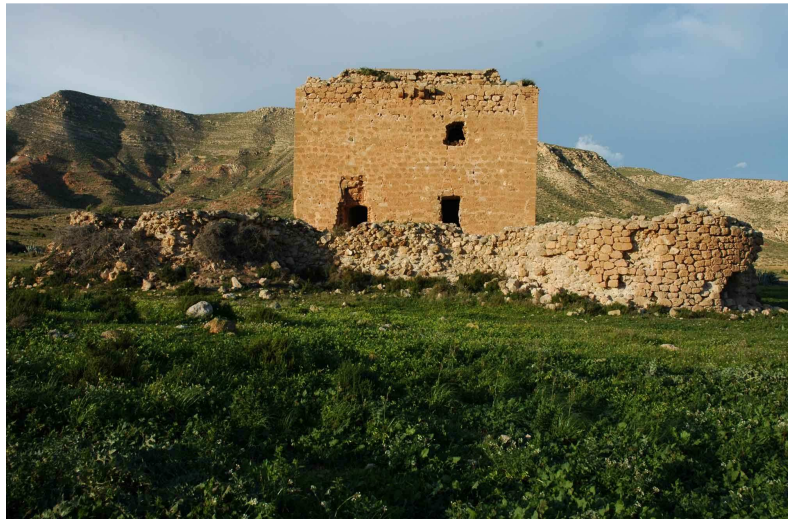
Torre Fuerte o de los Alumbres de Rodalquilar, desde el Sur