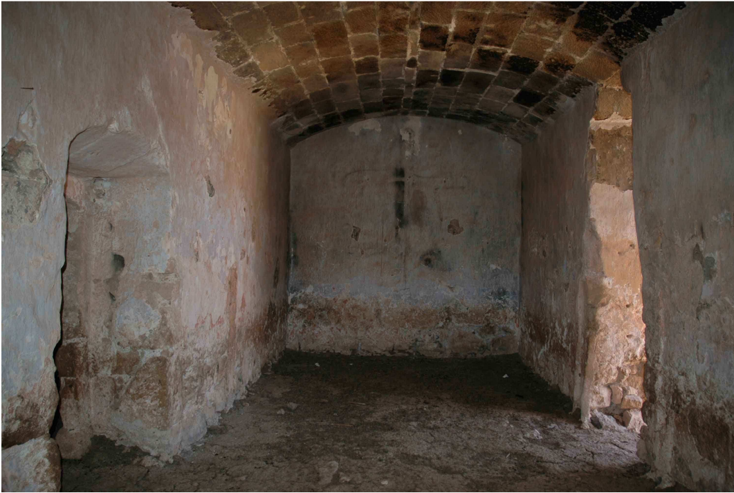
Bóveda de la planta principal de la torre Fuerte o de los Alumbres de Rodalquilar