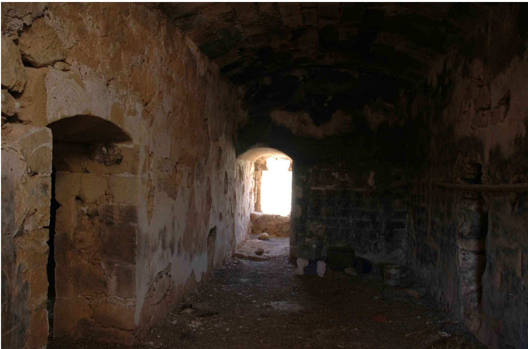
Bóveda de la planta superior de la torre Fuerte o de los Alumbres de Rodalquilar