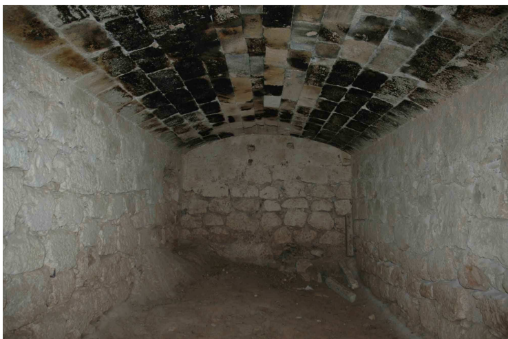
Bóveda de la planta inferior de la torre Fuerte o de los Alumbres de Rodalquilar