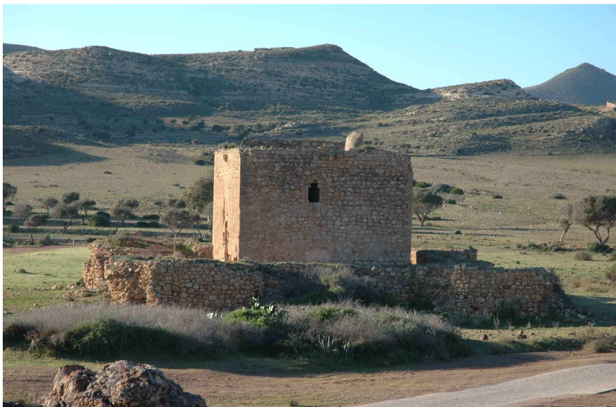
Torre Fuerte o de los Alumbres de Rodalquilar, desde el Norte