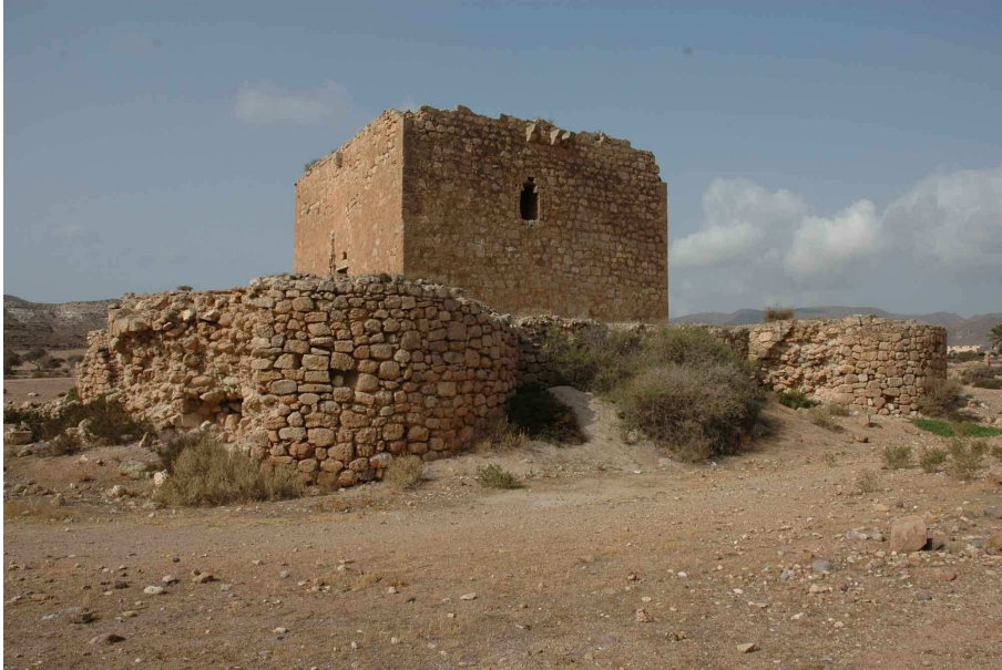
Torre Fuerte o de los Alumbres de Rodalquilar, desde el Noreste